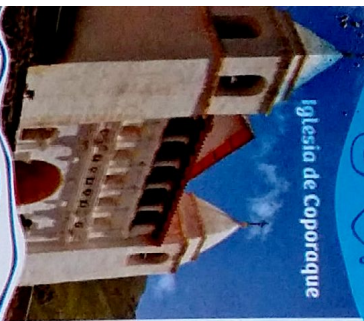
Iglesia de Coporaque