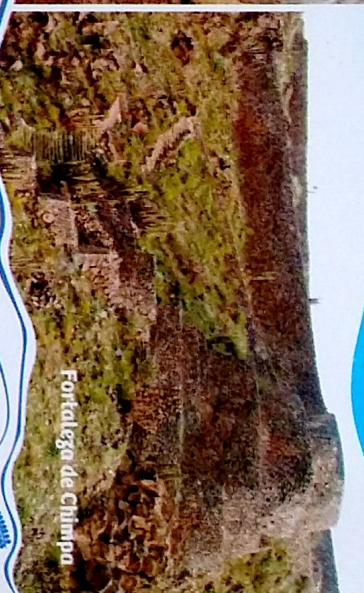
Fortaleza de Chimpia

Conformada por los distritos de Tapuy, Coporaque, Ichupampa, Lari y Madrigal. Con impresionantes recursos turísticos, como paisajes naturales con Cataratas, el nacimiento del río Amogonos, aguas termales, recursos arqueológicos, arquitectura colonial e inca, miradores y otros.