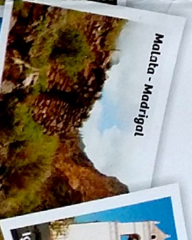
Malata - Madrigal