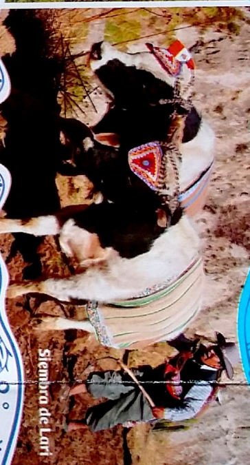
Siembra de Lari